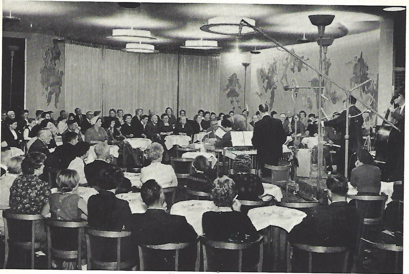
Overzichtsfoto gemaakt tijdens het optreden van de Kilima Hawaiian.

Foto's van de opname der groetenprogramma's voor opvarenden van het s.s. „KENIA” en s.s. „PHILLIPPIA”, welke op 27 oktober jl. in Hotel „Gooiland” te Hilversum plaats vond.