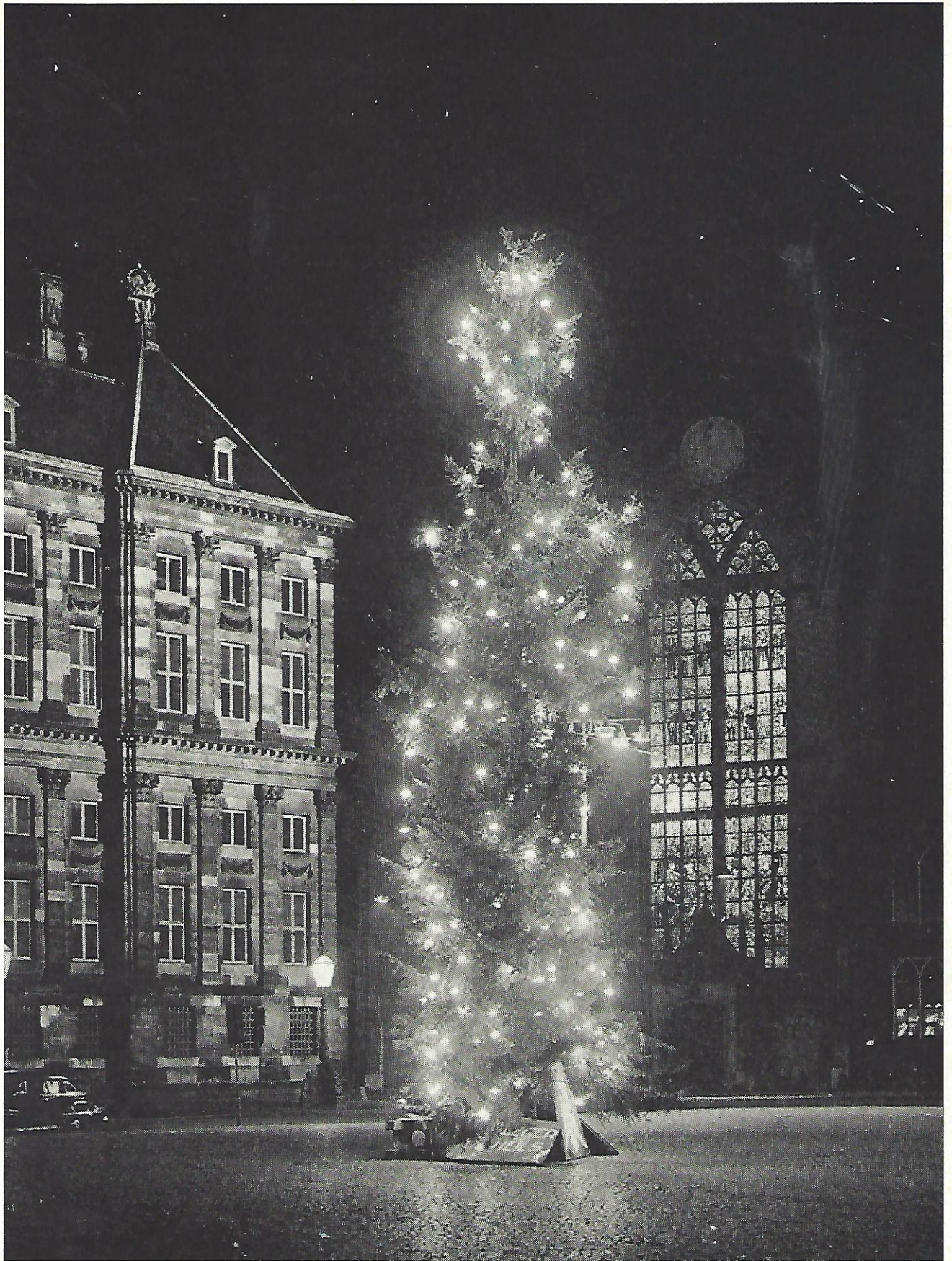
Decemberavond op de Dam in Amsterdam