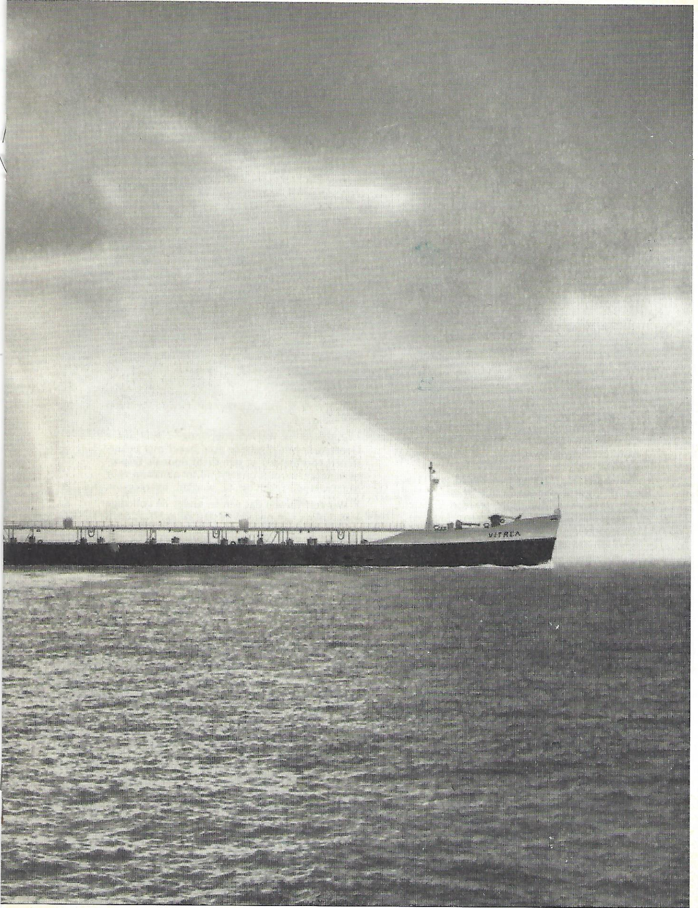
at o.o.v. in december 1961 in de vaart komt