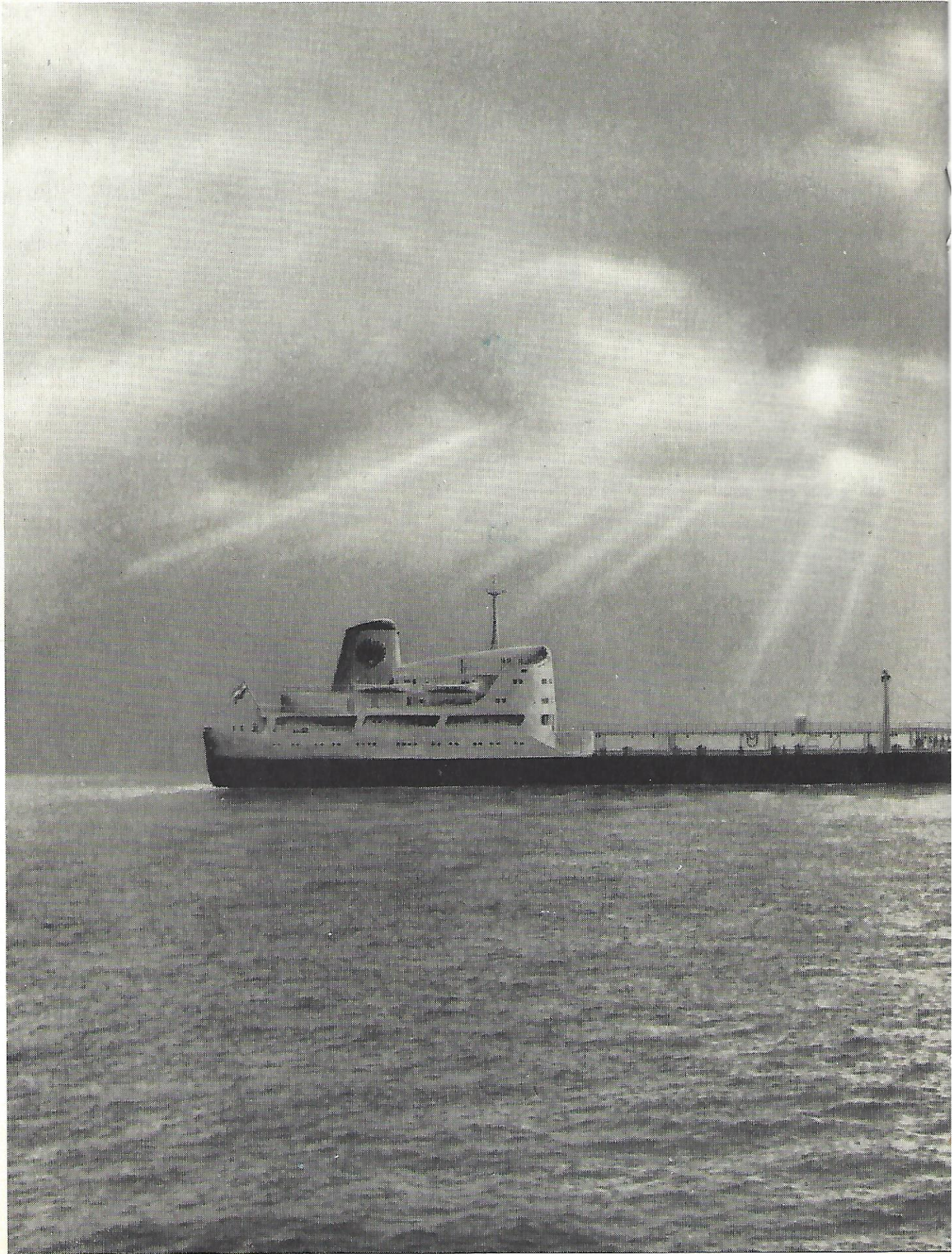
Artist-impression van het s.s. „VITREA” d